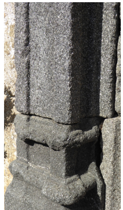
Portail en vagnérite de l'église St Étienne de Meyras

La vagnérite est très utilisée en Ardèche comme pierre de construction ornementale et cela même si les gisements sont très ponctuels car il s'agit souvent de filons de quelques mètres d'épaisseur. On utilisait ce matériau pour des pierres à fromage que l'on retrouve aujourd'hui en bac à fleurs. Mais c'est aussi une pierre utilisée dans le bâti ; le portail de l'église de Meyras en est un bon exemple en lien avec un filon local de vagnérite.