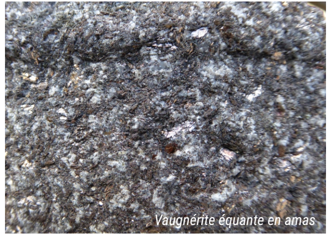
Vagnérite équante en amas

D'après notice technique de la carte géologique harmonisée du département de l'Ardèche/BRGM 2009